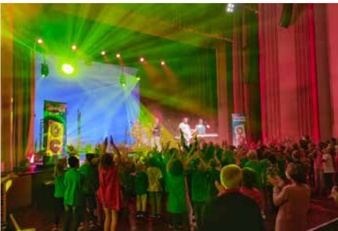
Konzert Pelemele