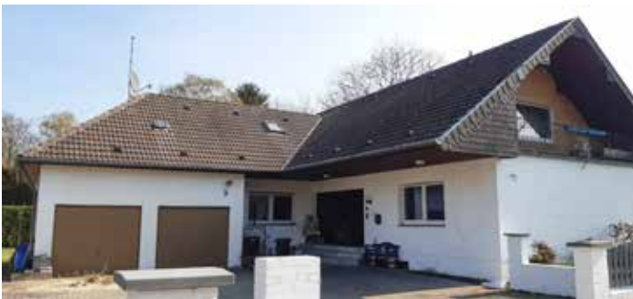
Vorher: Unbehandelte Dachfläche

Mit 25 Jahren Erfahrung im Dachdeckerhandwerk und 15 Jahren Spezialisierung auf Dachbeschichtungen stehen wir für Qualität, Zuverlässigkeit und nachhaltige Lösungen rund um ihr Dach und Ihre Fassade.