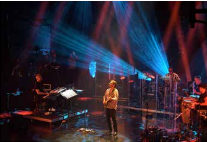
Al Di Meola_2024