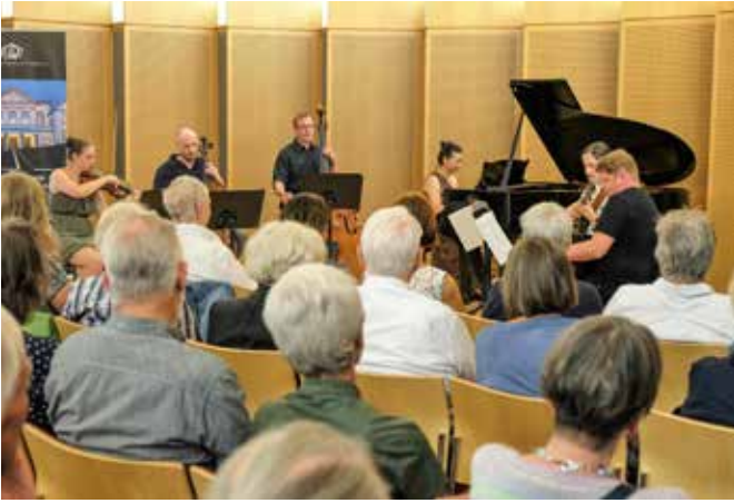
Konzert im Ernst-Klusen-Saal