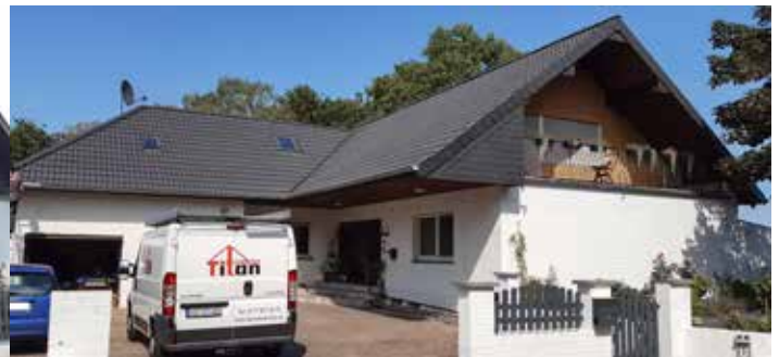
Nachher: Fertig beschichtet in Anthrazit

Wir nehmen uns Zeit für Ihr Anliegen und beraten Sie direkt vor Ort. Die Preise für eine Dachbeschichtung oder Sanierung richten sich nach Fläche, Neigung und Aufwand. Nach der Besichtigung erhalten Sie ein unverbindliches Angebot.